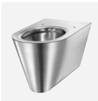
Sanita suspensa design Inox S21 S Ref. DELABIE: 110310

Ilustrações disponíveis no nosso site internet delabie.pt , rubrica Imprensa