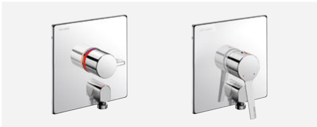
Refs. H9633 e 2551

A DELABIE redesenhou as suas misturadoras de duche encastradas, equipando-as com a nova caixa de encastre 100% estanque. Este sistema inovador pode ser adaptado a múltiplas configurações de instalação. A sua conceção, contribui tanto para a segurança dos pacientes, como para a prevenção de infeções nosocomiais e conforto em geral.