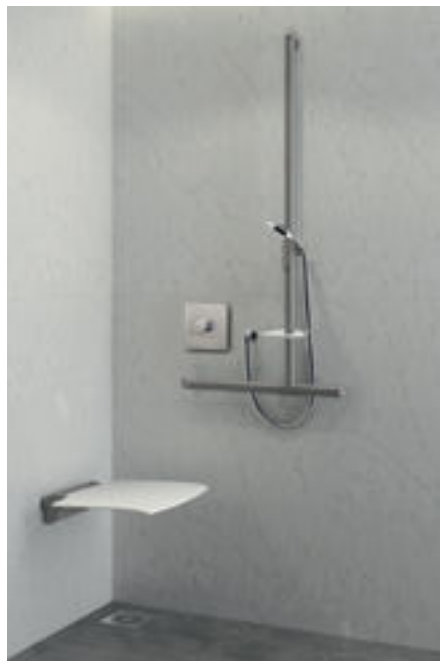
Exemplo de instalação de duche com misturadora H9631 Ref. DELABIE: H9631