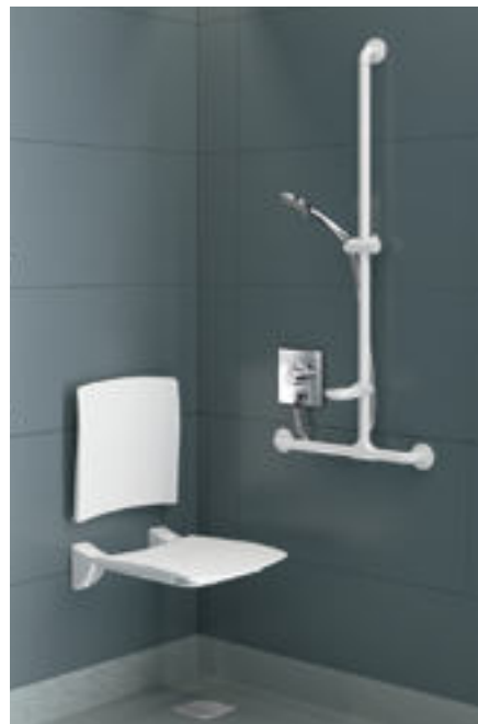
Exemplo de instalação de duche com misturadora H9633 Ref. DELABIE: DUCHE INTERNAMENTO H9633