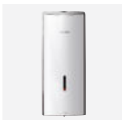
Doseador de sabão líquido eletrônico