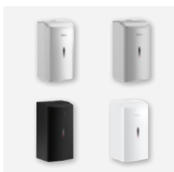
Design: disponível em 4 acabamentos