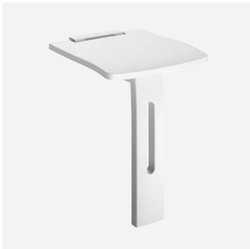
Banco de duche BASIC + Ref. DELABIE 510405

Ilustrações disponíveis no nosso site internet delabie.pt , rubrica Imprensa