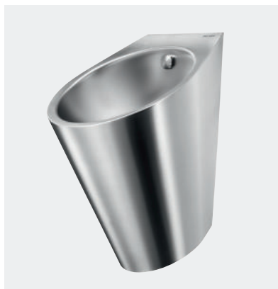
Urinol design Inox FINO Ref. DELABIE - 135710

Ilustrações disponíveis no nosso sítio da internet delabie.pt , rubrica Imprensa