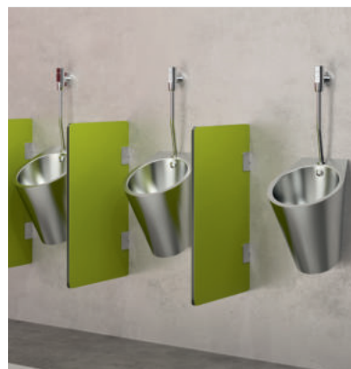
Exemplo de instalação Urinol Inox FINO