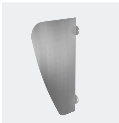
Separador de urinol AZA Ref. DELABIE: 100620

Ilustrações disponíveis no nosso site internet delabie.pt , rubrica Imprensa.