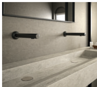
Exemplo de instalação, versão de parede da gama BLACK BINOPTIC Ref. 379ENCB