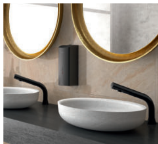
Exemplo de instalação, torneira eletrónica BLACK BINOPTIC Ref. 388035

O módulo eletrónico oferece uma ajuda ao diagnóstico por LED. O acesso aos seus componentes (pilhas, eletroválvula) é direto, sem desmontar a torneira. Não falta nada nesta concentração de tecnologias. O belo e o útil nunca ficaram tão bem juntos.