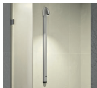
Exemplo de instalação, painel de duche eletrónico SPORTING 2 SECURITHERM Ref. 714900

Para além de ter sido pensado para o conforto dos utilizadores, o painel de duche eletrónico SPORTING 2 SECURITHERM está disponível em várias versões, independentemente da configuração, a fim de facilitar a sua instalação.