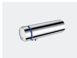
TEMPOMIX 3 (entradas de água encastradas) L.110 Ref. 794050

Esta abordagem do PLUS X AWARD é única. Os selos de qualidade do PLUS X AWARD são uma referência para os melhores produtos e um sinal evidente da qualidade de uma marca.