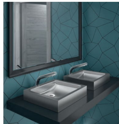
Exemplo de instalação Lavatório design Inox UNITO