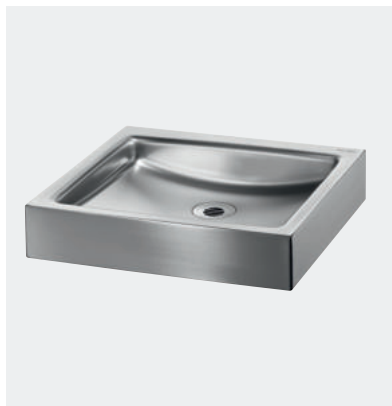
Lavatório design Inox UNITO Ref. DELABIE - 120810

Ilustrações disponíveis no nosso sítio da internet delabie.pt , rubrica Imprensa