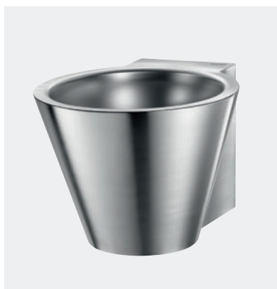
Lavatório design Inox MINI BAILA Ref. DELABIE - 120180

Ilustrações disponíveis no nosso sítio da internet delabie.pt , rubrica Imprensa