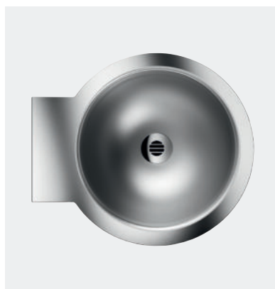
Lavatório design Inox MINI BAILA Ref. DELABIE - 120180 vista superior