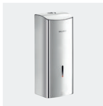
Doseador eletrónico de sabão líquido ou gel hidroalcoólico Ref. 512066P