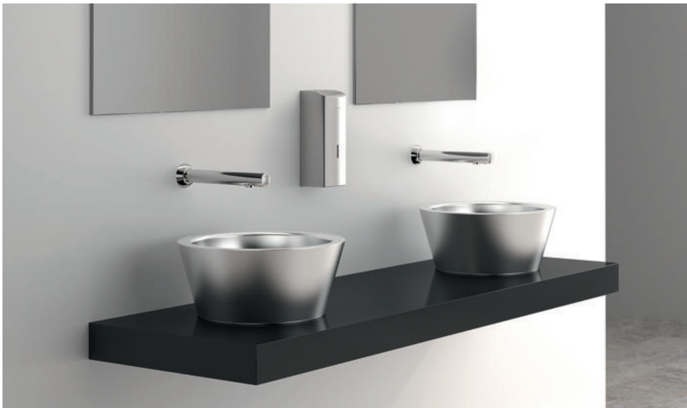
Lavatório de pousar Inox ALGUI - ref. 120110, Torneira eletrônica BINOPTIC - ref. 379ENC, Espelho retangular Inox - ref. 3459 e Doseador eletrônico mural de sabão líquido Inox 304 - ref. 512066S

No contexto atual da pandemia, a lavagem e a desinfecção das mãos estão no centro das preocupações dos utilizadores dos sanitários nos locais públicos. A higiene deve ser garantida ao máximo e as soluções sem contacto, são as mais procuradas. O respeito pelo primeiro gesto contra a propagação do vírus, vai andar a par com um consumo excessivo de água e energia. Mais do que nunca, a instalação de equipamentos sanitários que incorporem múltiplas funcionalidades adaptadas aos locais públicos, é inevitável.