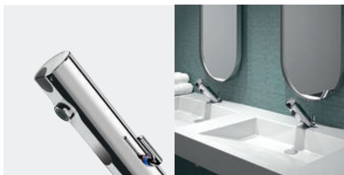
Misturadora eletrónica de lavatório TEMPOMATIC 4 Ref. 490000

Ilustrações disponíveis no nosso sítio da internet delabie.pt :