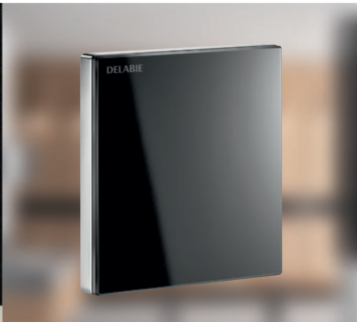
Ref.: 430PBOX-430036 TEMPOMATIC 4 de urinol