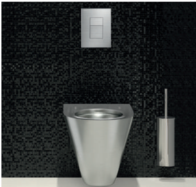
Ref.: 763BOX-763000 Descarga direta TEMPOFLUX 3