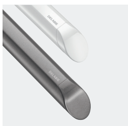
Barras de apoio Be-Line® antracite metalizado ou branco mate