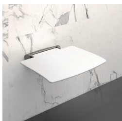
Banco de duche Be-Line®