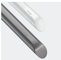
Barras de apoio Be-Line® antracite metalizado ou branco mate