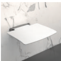
Banco de duche sem pé Be-Line®