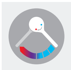
Abertura e fecho sequenciais sobre a água fria

A única misturadora sequencial de parede do mercado com a função de choque térmico sem desmontar o manípulo