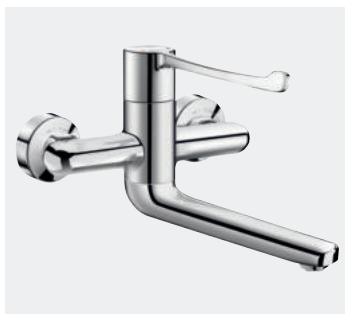
Misturadora mecânica sequencial de parede - Bica fixa/orientável L.200 Ref. DELABIE : 2641