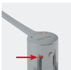
Função choque térmico