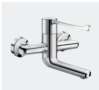
Misturadora mecânica sequencial de parede Bica fixa/orientável L.120 Ref. DELABIE : 2640

Ilustrações disponíveis no nosso sítio da internet delabie.pt , rubrica Imprensa.