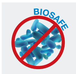
Higiene e controlo da proliferação bacteriana