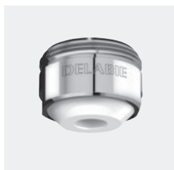
Saída de bica BIOSAFE